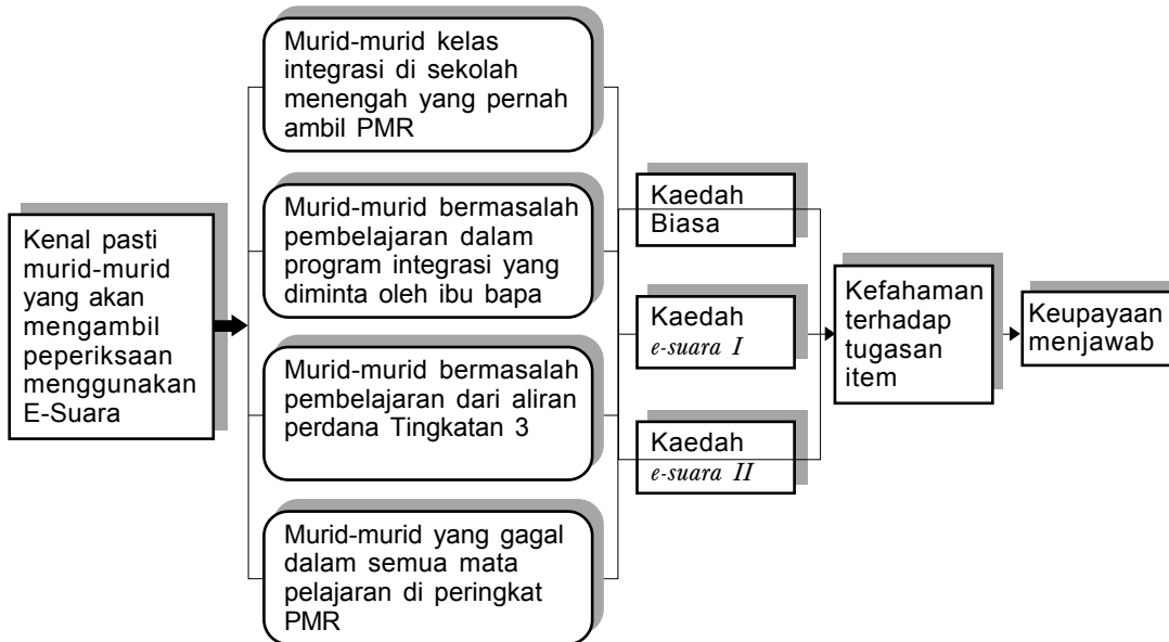
Rajah 1 Kerangka pemilihan sampel

memperkenalkan sebuah sistem pentaksiran bagi murid-murid pendidikan khas bermasalah pembelajaran. Asas pemilihan sampel pelajar pendidikan khas diperlihatkan melalui kerangka (Rajah 1) diadaptasi daripada model pentaksiran alternatif e-suara yang pernah diuji oleh murid-murid pekak oleh Lembaga Peperiksaan Malaysia, Kementerian Pelajaran Malaysia.