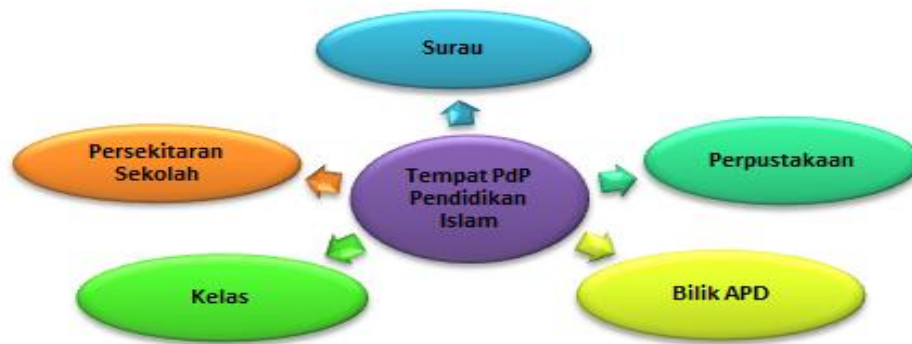
Rajah 1 Model Tempat Pengajaran dan Pembelajaran (P&P) Pendidikan Islam

Justeru, berdasarkan hasil dapatan kajian pengkaji menghasilkan satu model yang dinamakan Model Tempat Pengajaran dan Pembelajaran (P&P) Pendidikan Islam. Model ini digambarkan oleh pengkaji sebagaimana yang tertera pada Rajah 1.